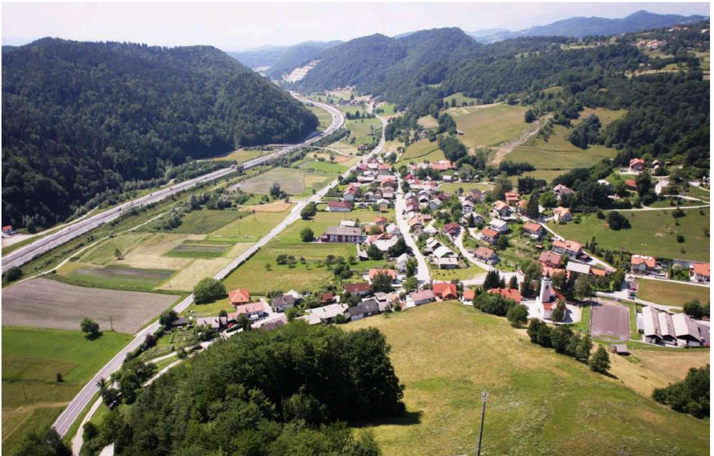
Pogled na Krašnjo iz vzhoda.