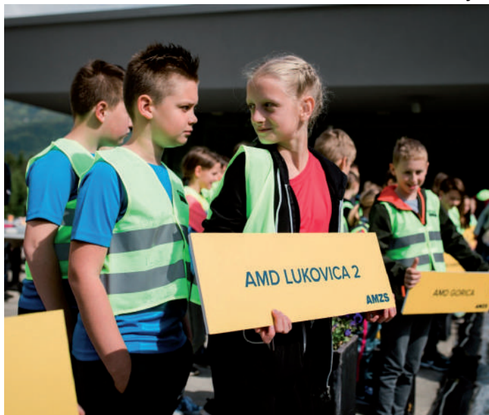
Ekipa AMD Lukovica na izbirnem tekmovanju mladih kolesarjev