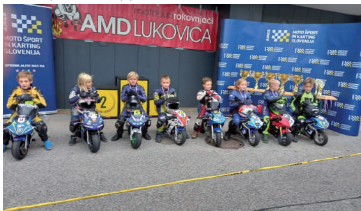
Najmlajši slovenski dirkači po dirki mini CHD na Vranskem