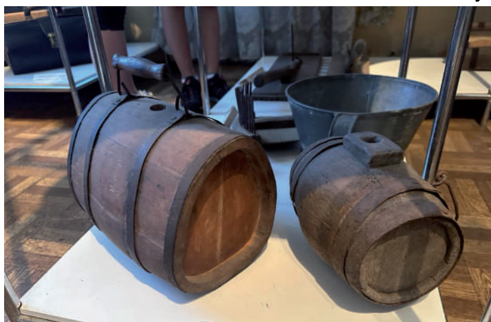
Učenci Pš Krašnja