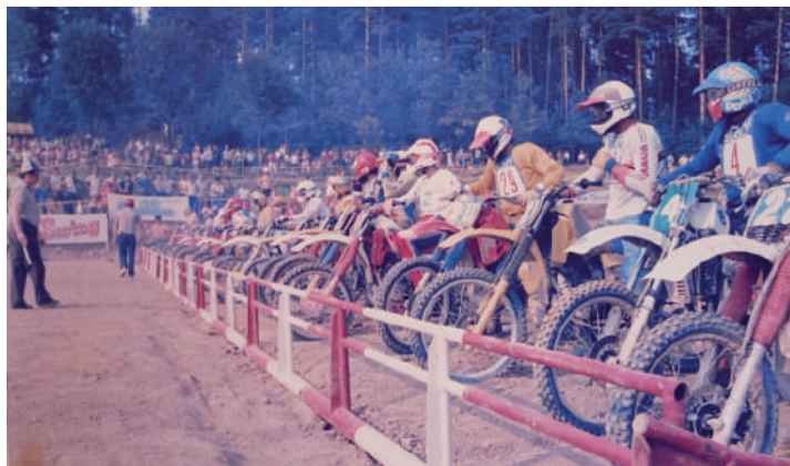
Najboljši jugoslovanski motokrosisti na štartni rampi – Močilnik pri Dobu