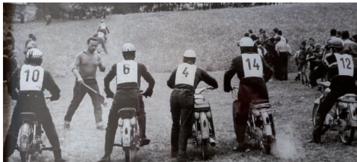
Štart tekmovalcev s specialnimi mopedi. Vv nedeljo 12.9.1965 je AMD Lukovica je organiziralo prvi mopedkros v Jugoslaviji, na katerem so tekmovali samo mopedisti. Tekmovanje je bilo izvedeno še trikrat, leta 1966, 1968 in 1971.